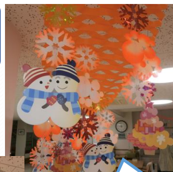
棟内の季節装飾が冬バージョンに変わりました！