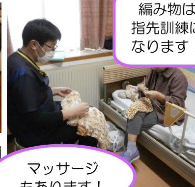
編み物は指先訓練になります！