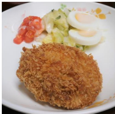
外はサクサク、中はふんわり！