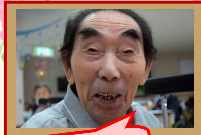
祝ってくれてありがとうね~