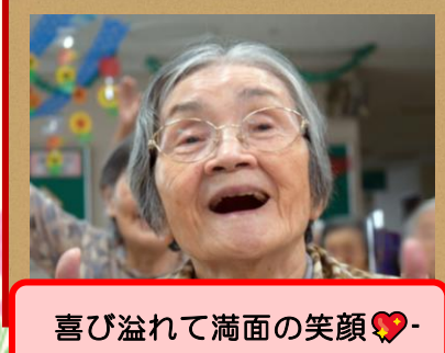
喜び溢れて満面の笑顔♡-