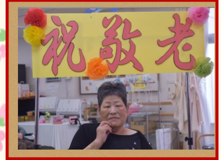
元気で長生きします!